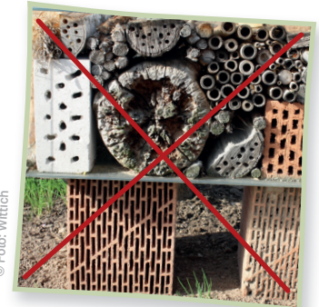
So bitte nicht