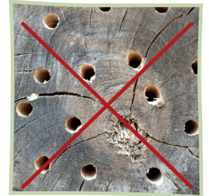
Bohren Sie nicht ins Stirnholz!

Achten Sie besonders darauf, scharfe Werkzeuge zu nutzen, sorgfältig zu bohren und die Späne aus den Löchern zu entfernen. Benutzen Sie Holzbohrer verschiedener Durchmesser (2 bis 9 Millimeter) und schaffen Sie etwa 10 Zentimeter tiefe Löcher, gerne auch tiefer.