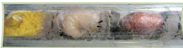
Pollenbrot mit Ei – Larve – Puppe

Nach 3 bis 6 Tagen schlüpft bei den meisten Arten aus dem Ei die Larve. Diese ernährt sich vom Pollenbrot, welches ihr das Muttertier zuvor in die Nistkammer legte. Die Larve entwickelt sich wohlgenährt über mehrere Stadien und überwintert meist als Puppe oder Imago. Im darauffolgenden Frühling gräbt sie sich durch die Nestverschlüsse. Erst fliegen die Männchen aus, die nicht selten auf die später folgenden Weibchen warten, um sich sogleich zu paaren.