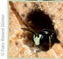
Maskenbiene am Nesteingang

Tipp: Auch wenn es gut gemeint ist: Tannenzapfen, Stroh und rote Lochziegel aus Ton bringen in einer Nisthilfe kaum mehr, als hübsch auszusehen.