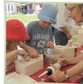
Bausätze sind gut geeignet

Wenn Sie gerne Wildbienen beobachten, sind Nisthilfen eine geeignete Möglichkeit, dies zu tun. Sie können diese mit geringem Zeit- und Kostenaufwand selber bauen. Oberirdisch nistende Wildbienen brauchen dafür vor allem vier Dinge: Bruträume mit geeignetem Durchmesser, einen Regen-