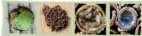
Blattschneiderbiene Mauerbiene Scherenbiene Maskenbiene